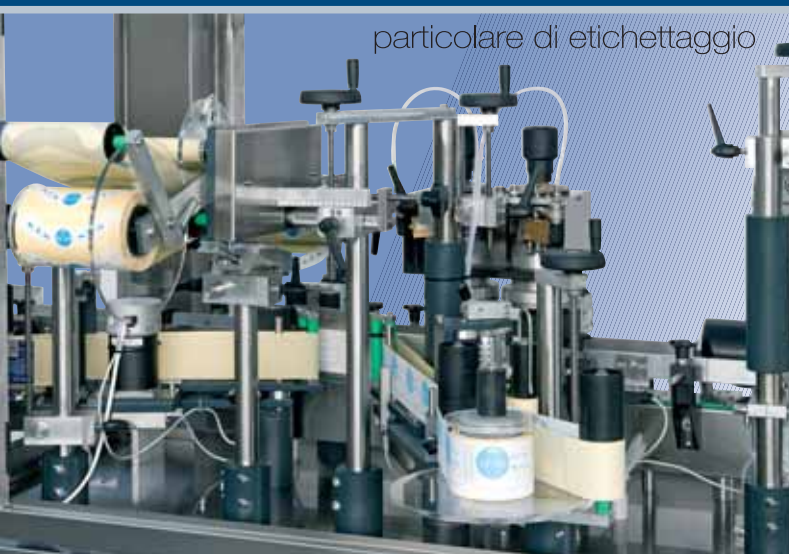
particolare di etichettaggio

Prima dell'etichettatura la bottiglia viene posizionata con sistema di orientamento fotoelettrico, per l'esatto centraggio di capsulone, collarone champagne ed etichetta di corpo. Monitor touch screen per memorizzare 30 diversi formati. Velocità variabile elettronica con inverter.